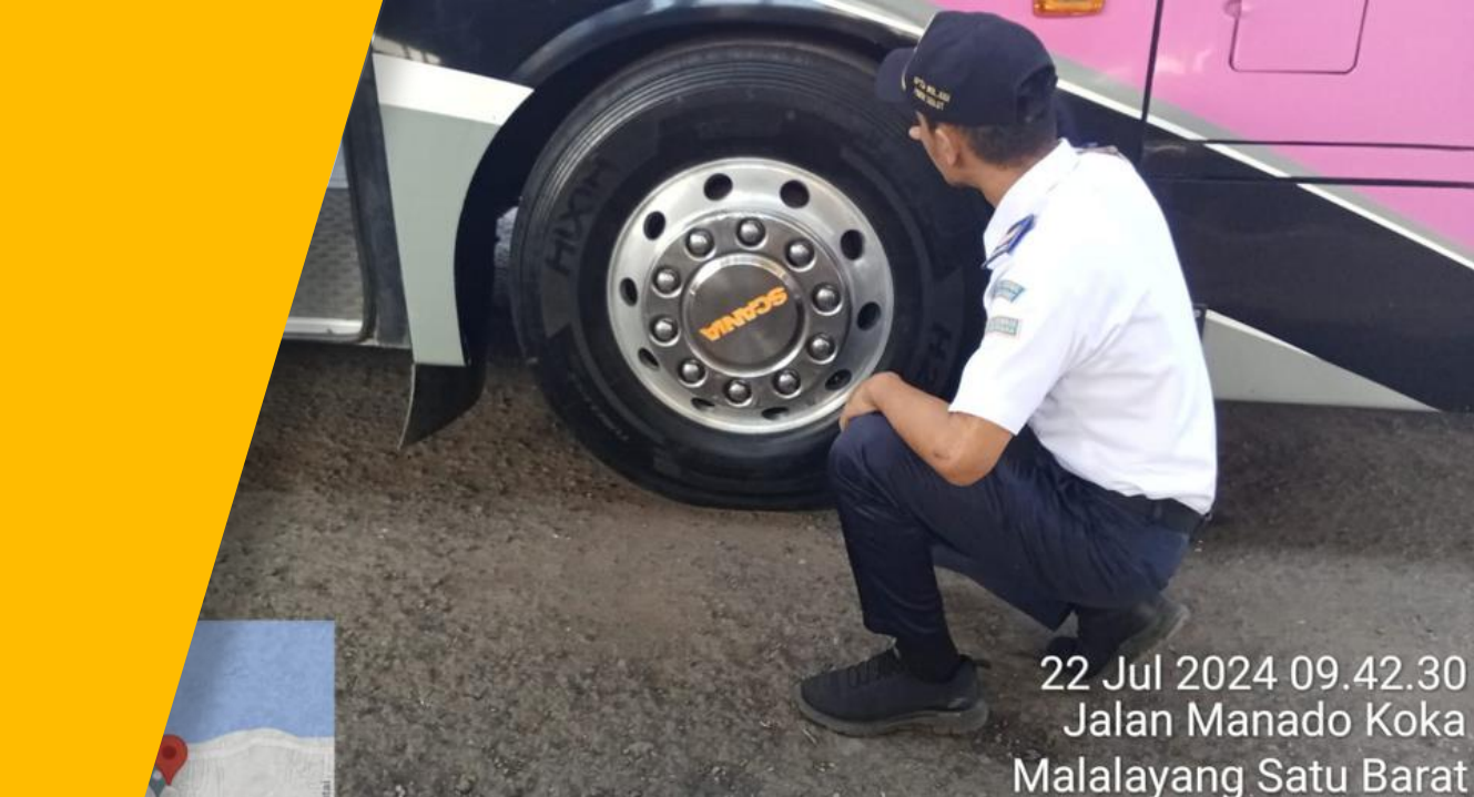
22 Jul 2024 09.42.30 Jalan Manado Koka Malalayang Satu Barat