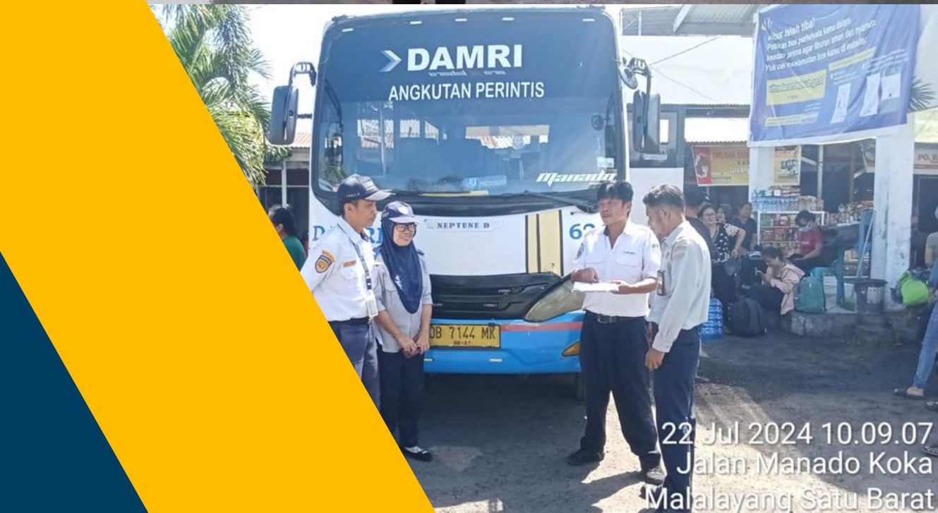
22 Jul 2024 10.09.07 Jalan Manado Koka Malalayang Satu Barat