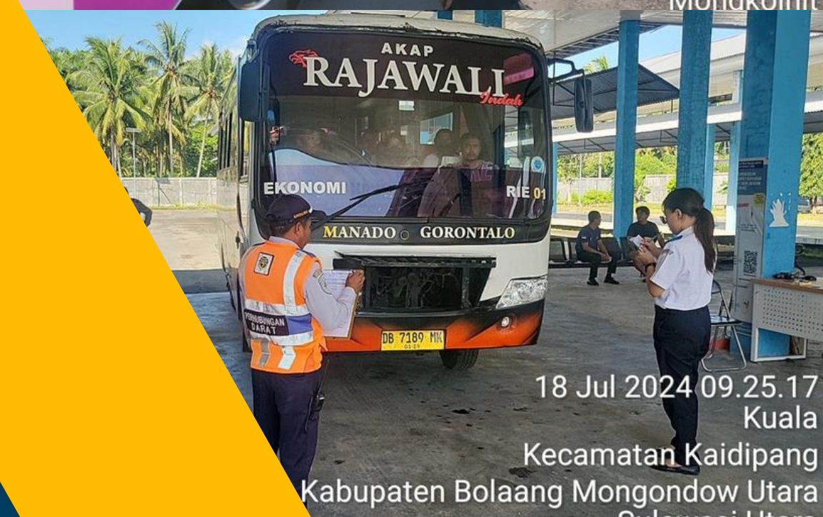
18 Jul 2024 09.25.17 Kuala Kecamatan Kaidipang Kabupaten Bolaang Mongondow Utara Sulawesi Utara