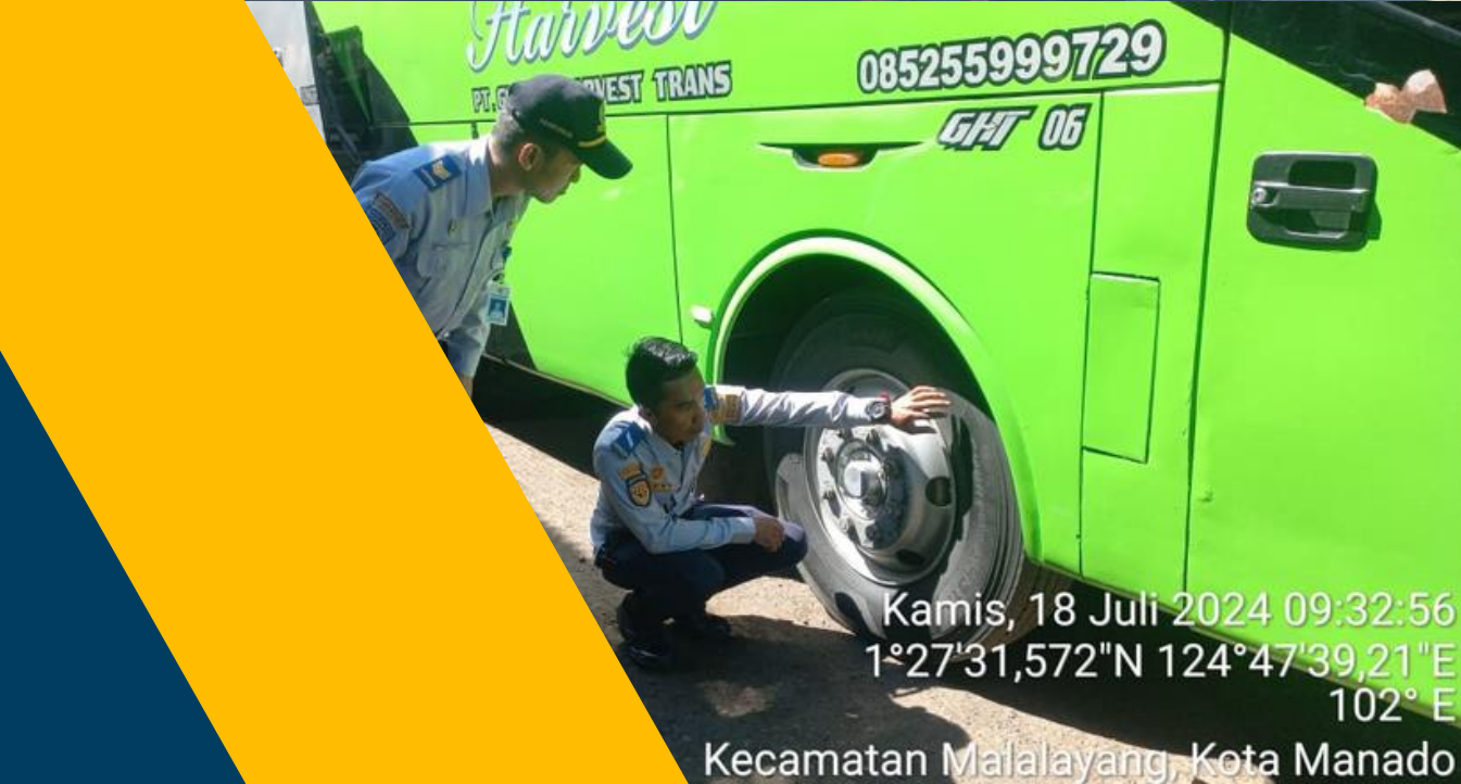
Kamis, 18 Juli 2024 09:32:56 1°27'31,572"N 124°47'39,21"E 102° E