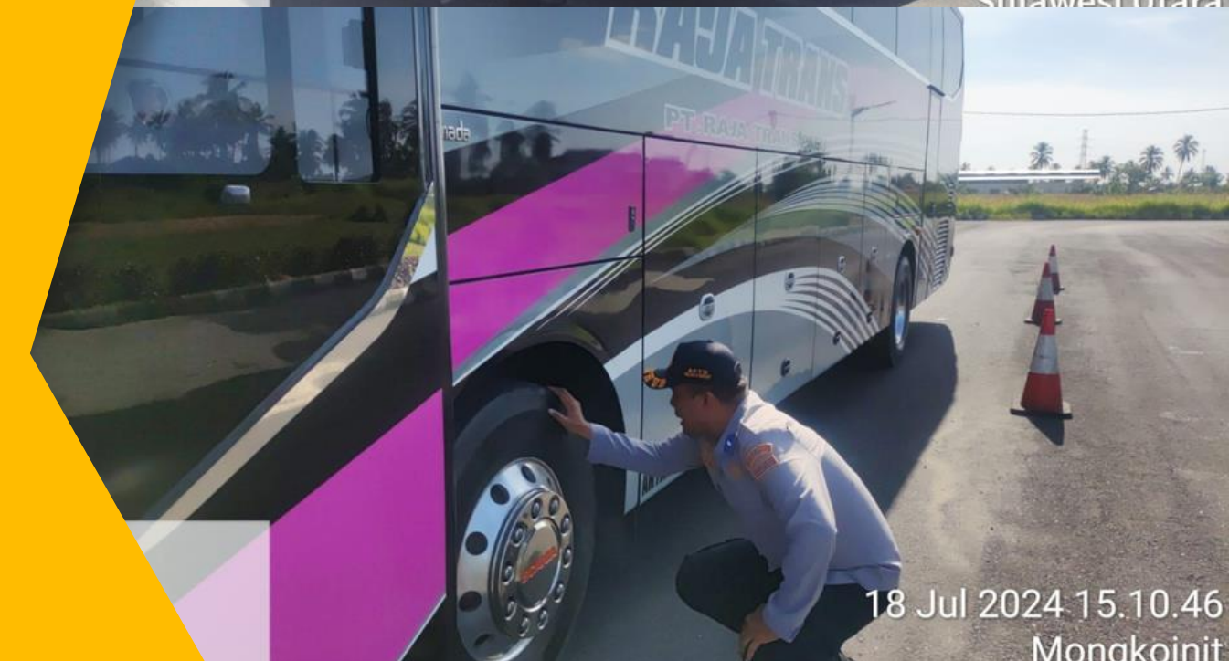
18 Jul 2024 15.10.46 Mongkoinit