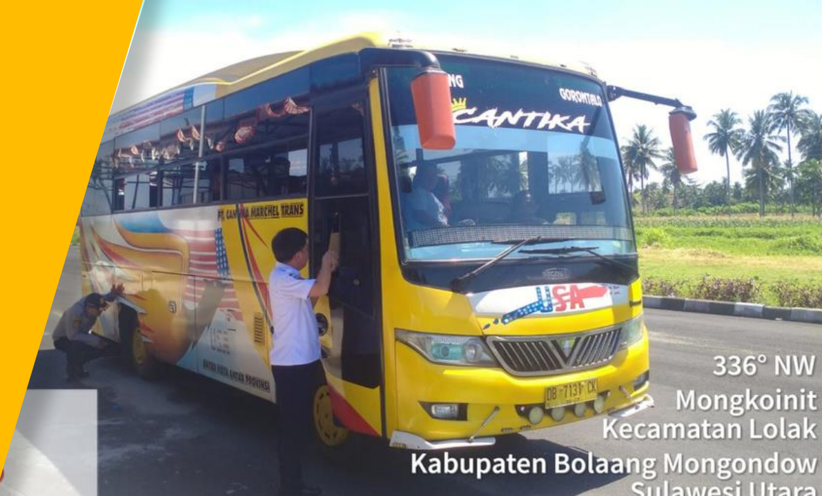
336° NW Mongkoinit Kecamatan Lolak Kabupaten Bolaang Mongondow Sulawesi Utara