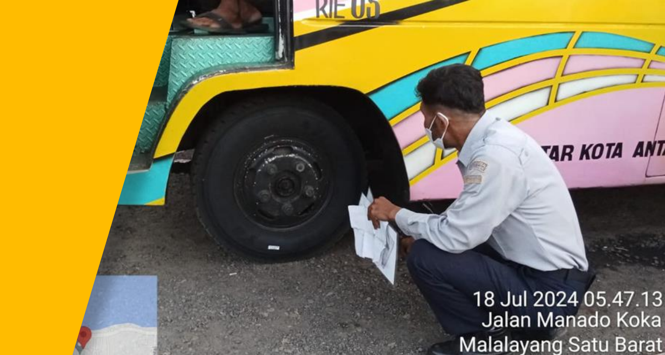
18 Jul 2024 05:47:13 Jalan Manado Koka Malalayang Satu Barat