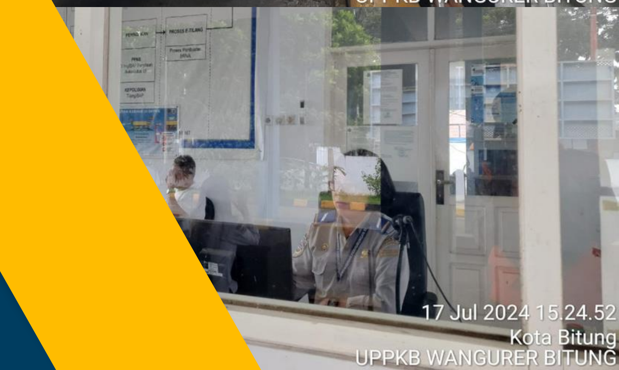
17 Jul 2024 15.24.52 Kota Bitung UPPKB WANGURER BITUNG