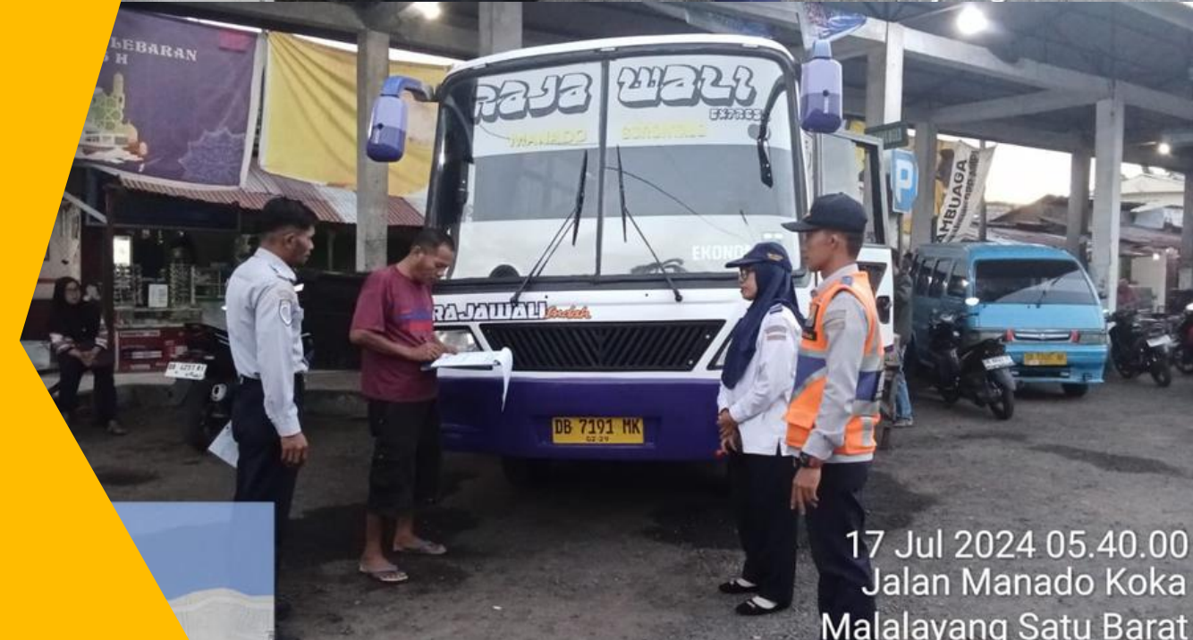
17 Jul 2024 05.40.00 Jalan Manado Koka Malalayang Satu Barat