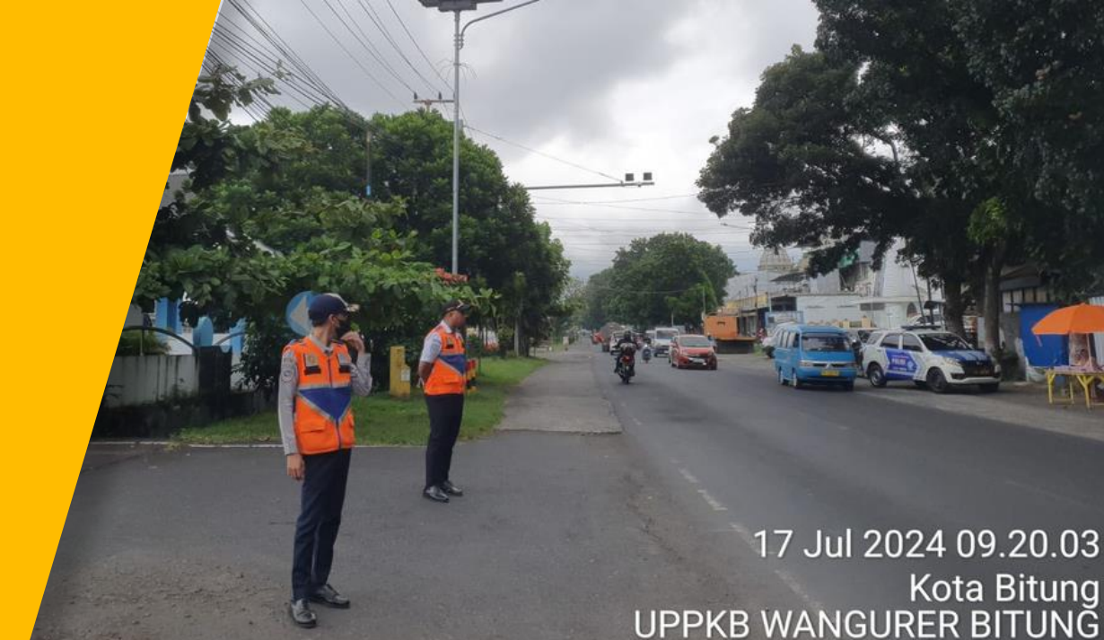
17 Jul 2024 09.20.03 Kota Bitung UPPKB WANGURER BITUNG