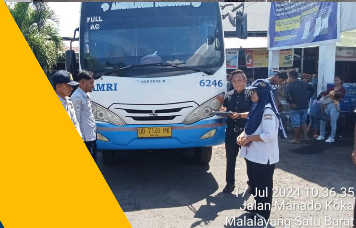
17 Jul 2024 10.36.35 Jalan Manado Koka Malalayang Satu Barat