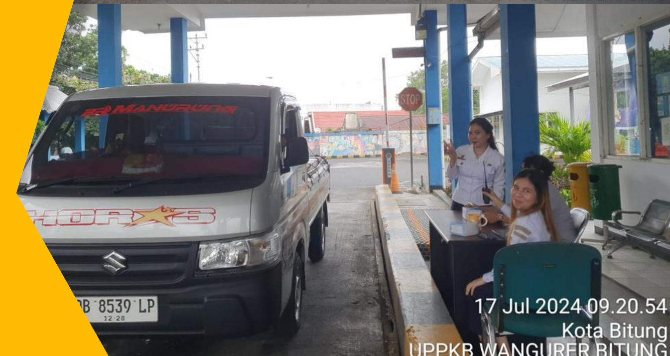
17 Jul 2024 09.20.54 Kota Bitung UPPKB WANGURER BITUNG