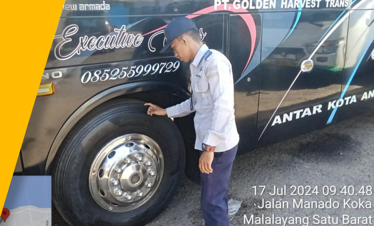
17 Jul 2024 09.40.48 Jalan Manado Koka Malalayang Satu Barat