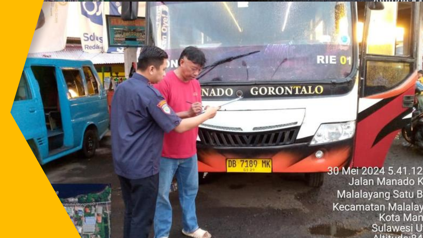
30 Mei 2024 5.41.12 Jalan Manado K Malalayang Satu B Kecamatan Malalay Kota Man Sulawesi U Altitude: 84