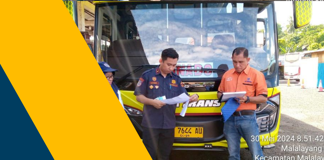
30 Mei 2024 8.51.42 Malalayang Kecamatan Malalaya