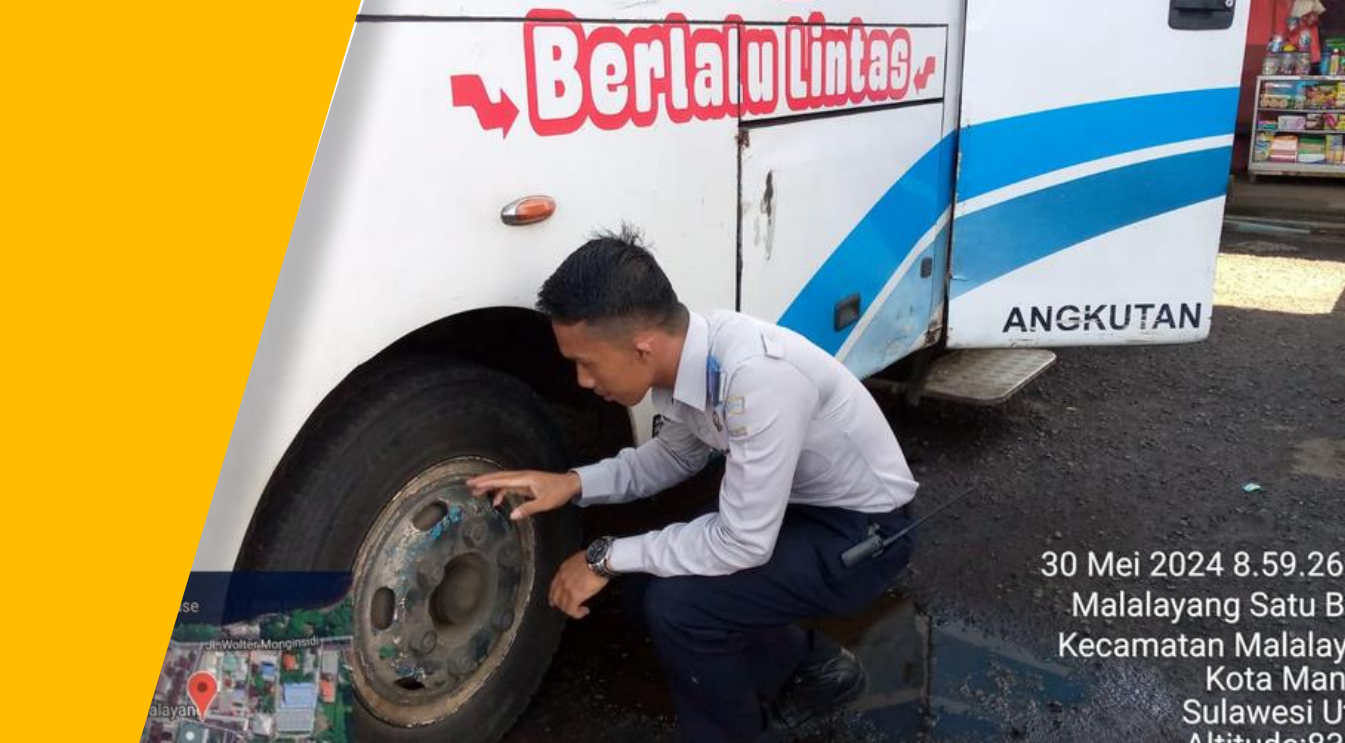
30 Mei 2024 8.59.26 Malalayang Satu B Kecamatan Malalay Kota Man Sulawesi U Altitude: 82