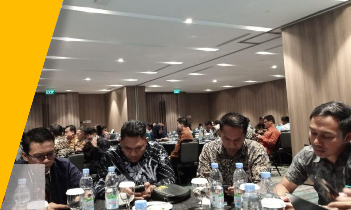
Banten Indonesia Lengkong Gudang

Kegiatan PPK dan Bendahara Pengeluaran di Trembesi Hotel, BSD Banten pada tanggal 20-22 Mei 2024 dalam keikutsertaan di kegiatan Sosialisasi Peraturan Menteri Keuangan tentang Standar Biaya Biaya Masukan TA. 2023 dan Bagan Akun Standar, Identifikasi dan Inventarisasi Temuan Pemeriksaan BPK RI TA. 2023 serta Cek Posisi Realisasi Anggaran dan Sisa Anggaran 2024. Kegiatan ini dibuka langsung oleh Kepala Bagian Keuangan Ditjen Hubdat.