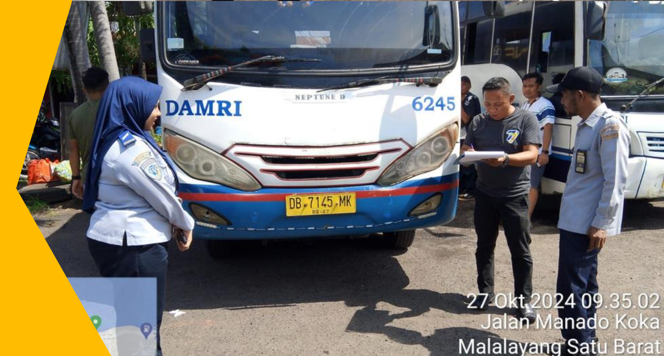
27 Okt 2024 09.35.02 Jalan Manado Koka Malalayang Satu Barat