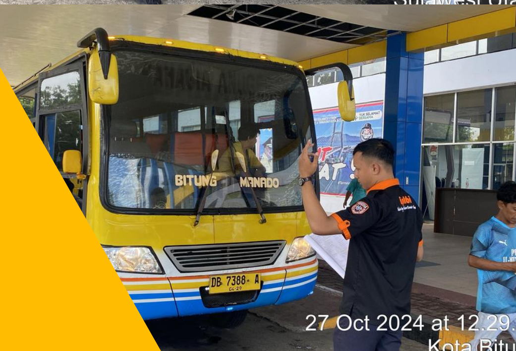
27 Oct 2024 at 12.29. Kota Bitu