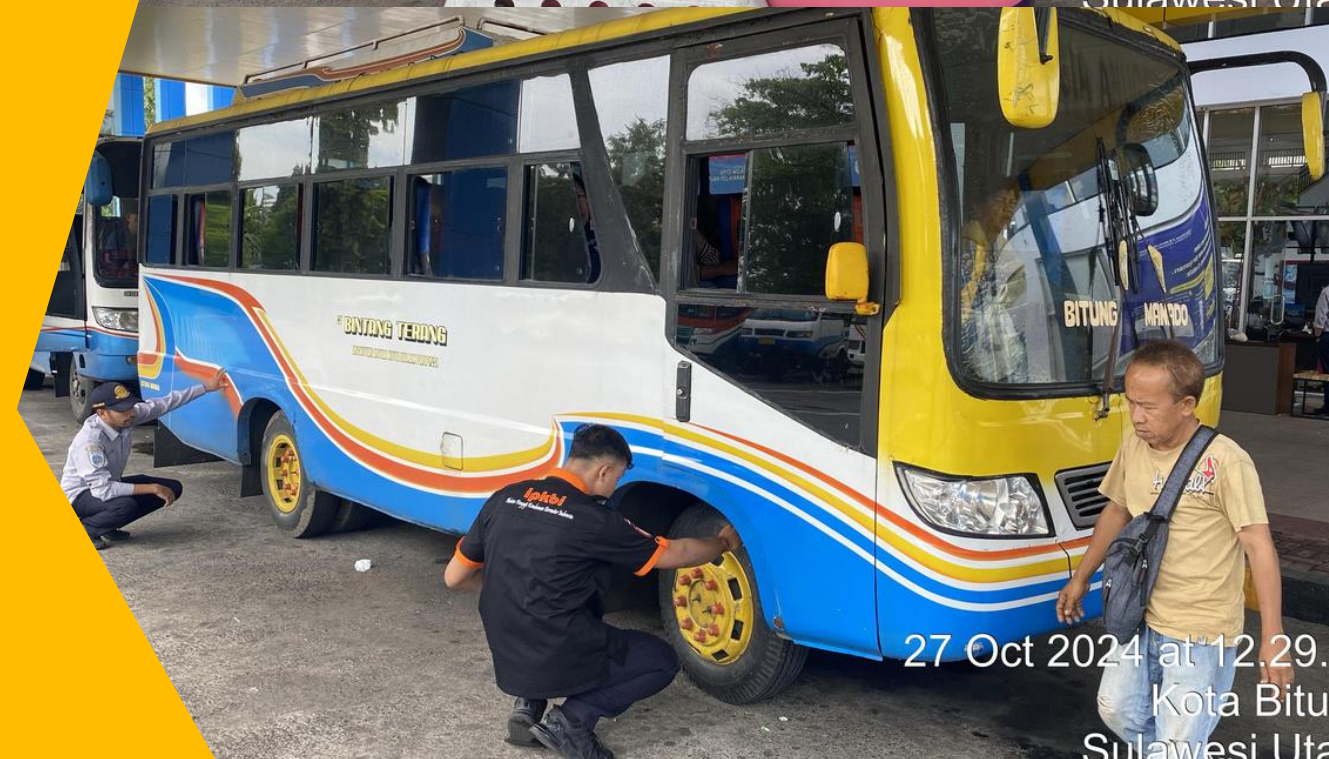
27 Oct 2024 at 12.29. Kota Bitu Sulawesi Uta