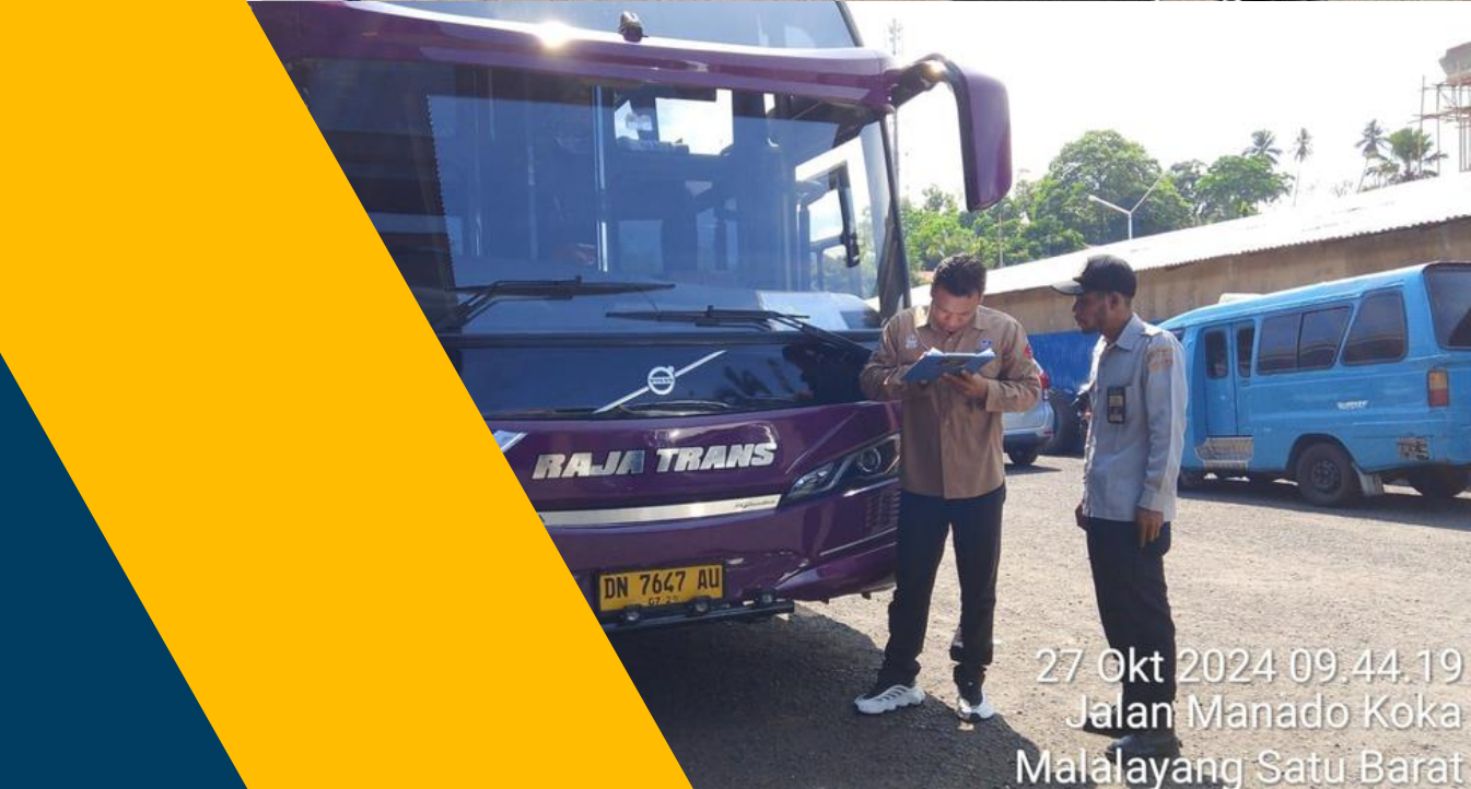
27 Okt 2024 09.44.19 Jalan Manado Koka Malalayang Satu Barat