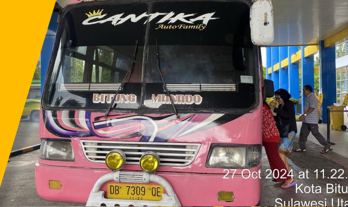
27 Oct 2024 at 11.22. Kota Bitu Sulawesi Uta