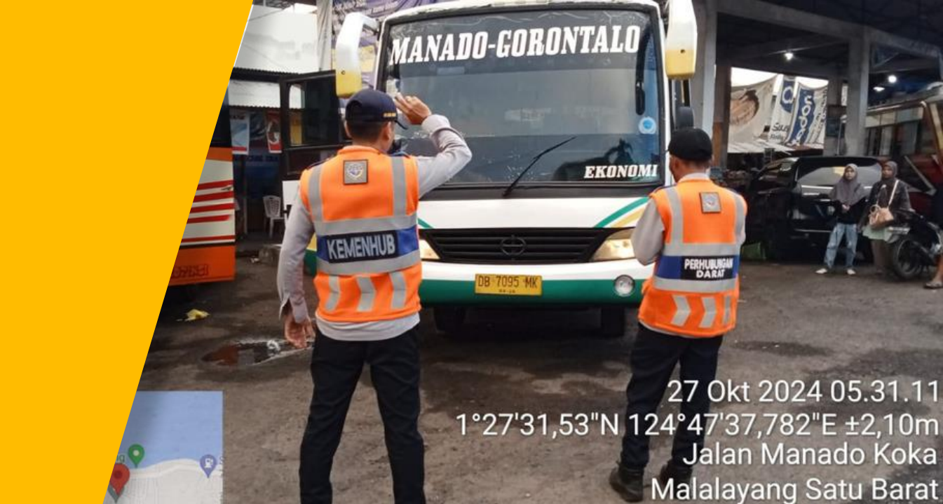
27 Okt 2024 05.31.11 1°27'31,53"N 124°47'37,782"E ±2,10m Jalan Manado Koka Malalayang Satu Barat