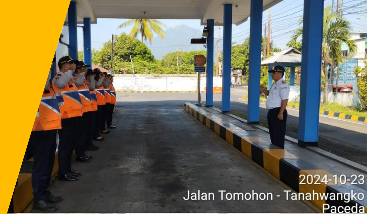
2024-10-23 Jalan Tomohon - Tanahwangko Paceda