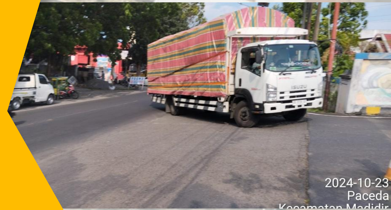
2024-10-23 Paceda Kecamatan Medidi