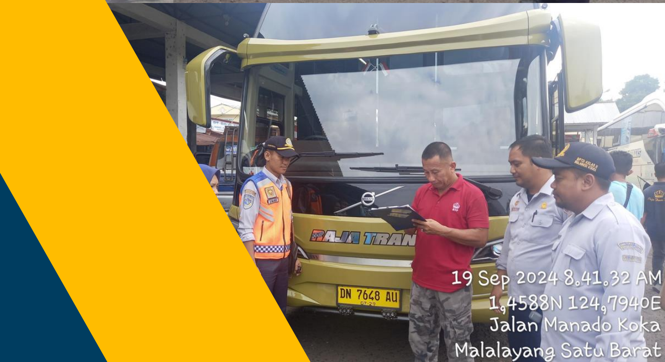
19 Sep 2024 8.41.32 AM 1,4588N 124,7940E Jalan Manado Koka Malalayang Satu Barat