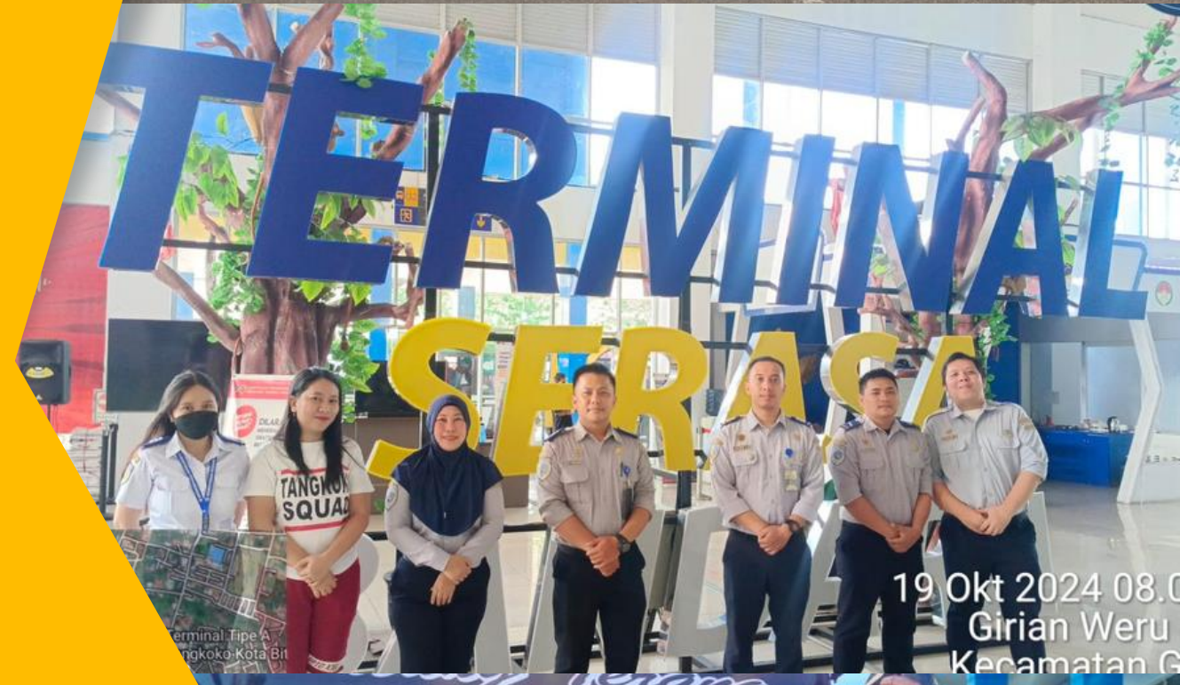
19 Okt 2024 08.0 Girian Weru Kecamatan G