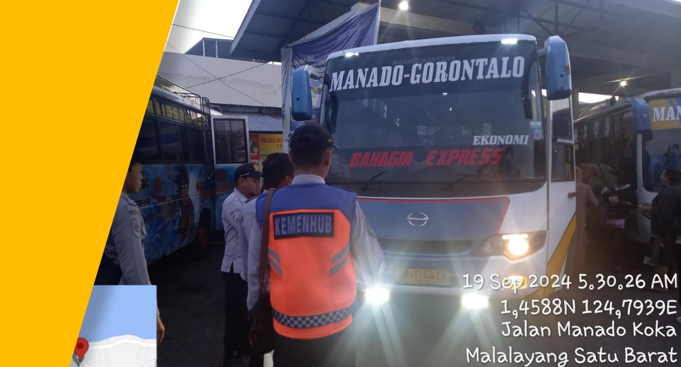
19 Sep 2024 5.30.26 AM 1,4588N 124,7939E Jalan Manado Koka Malalayang Satu Barat