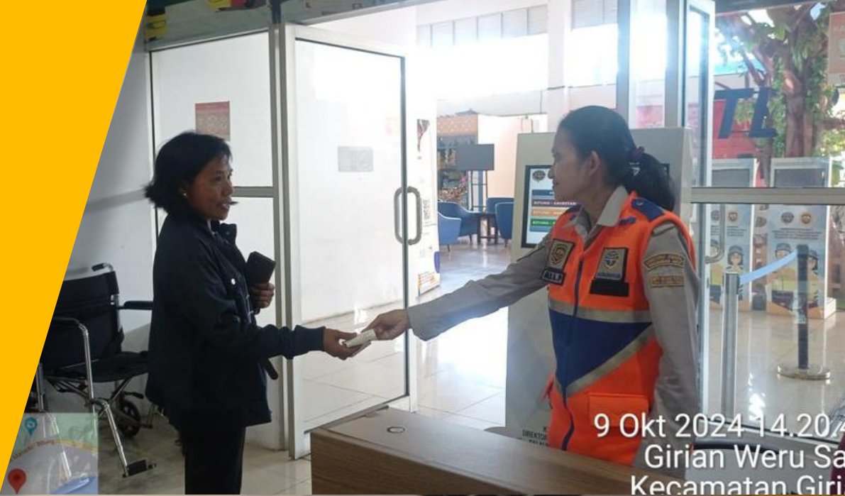
9 Okt 2024 14.20.14 Girian Weru Sa Kecamatan Giri