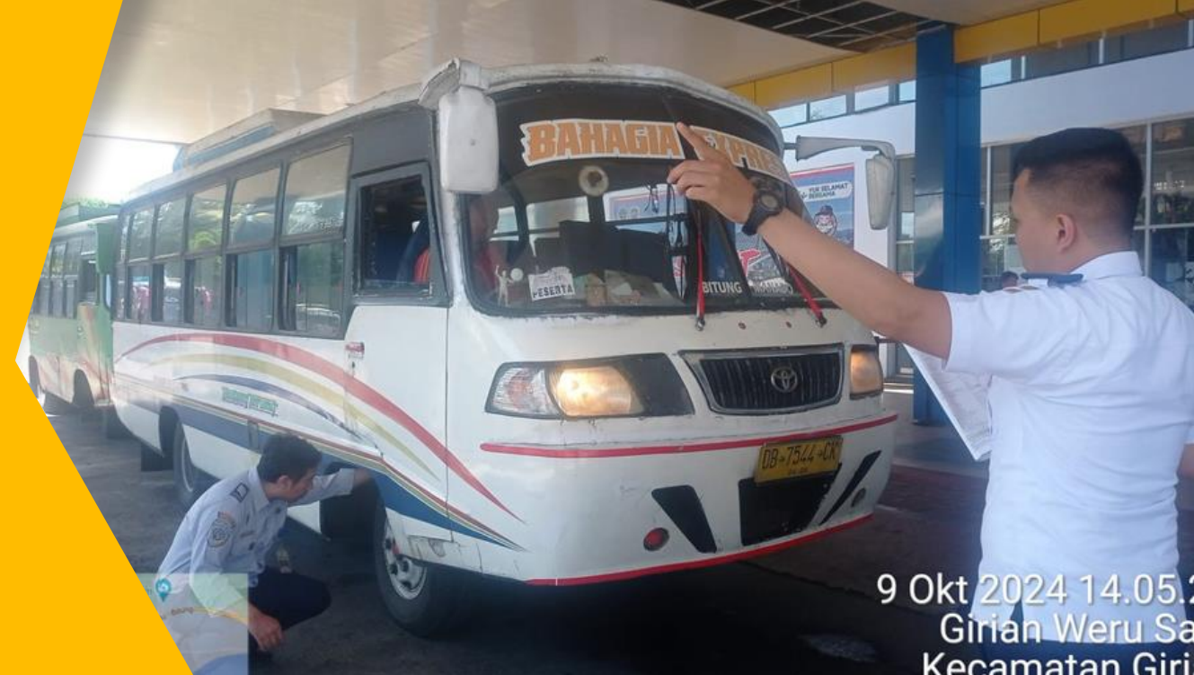
9 Okt 2024 14.05.14 Girian Weru Sa Kecamatan Giri