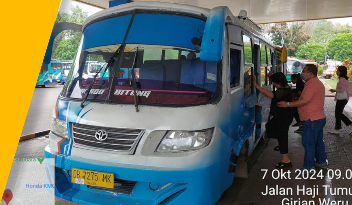
7 Okt 2024 09.0 Jalan Haji Tumu Girian Weru Jalan Haji Tumu Girian Weru S Kecamatan Gi Kota Bit Sulawesi U