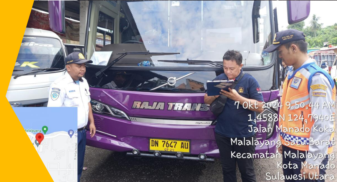
7 Okt 2024 9.50.44 AM 1,4588N 124,7940E Jalan Manado Koka Malalayang Satu Barat Kecamatan Malalayang Kota Manado Sulawesi Utara