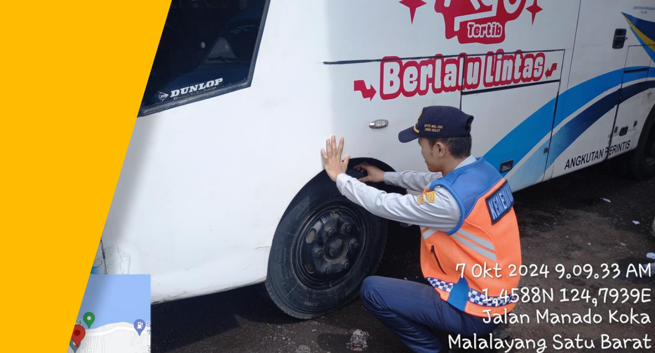
7 Okt 2024 9.09.33 AM 1,4588N 124,7939E Jalan Manado Koka Malalayang Satu Barat