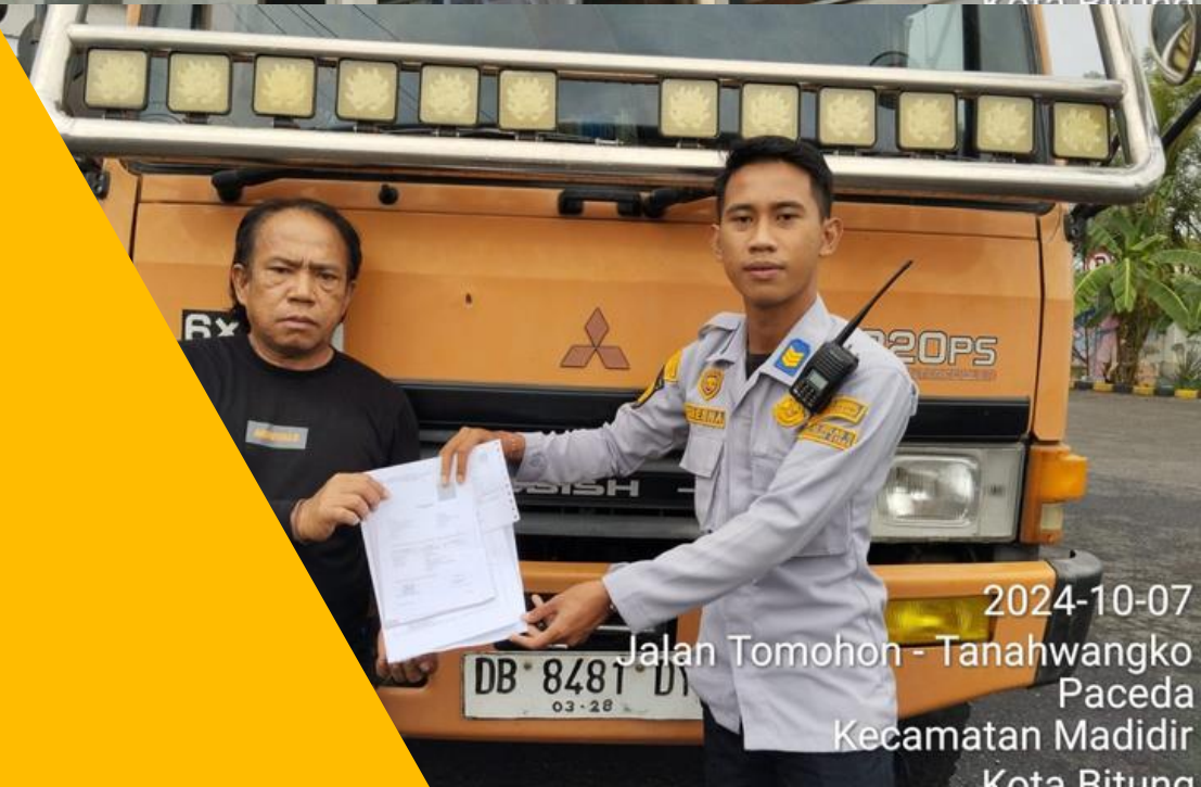
2024-10-07 Jalan Tomohon - Tanahwangko Paceda Kecamatan Madidir Kota Bitung