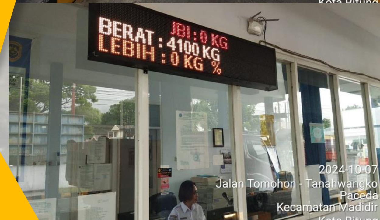
2024-10-07 Jalan Tomohon - Tanahwangko Paceda Kecamatan Madidir Kota Bitung