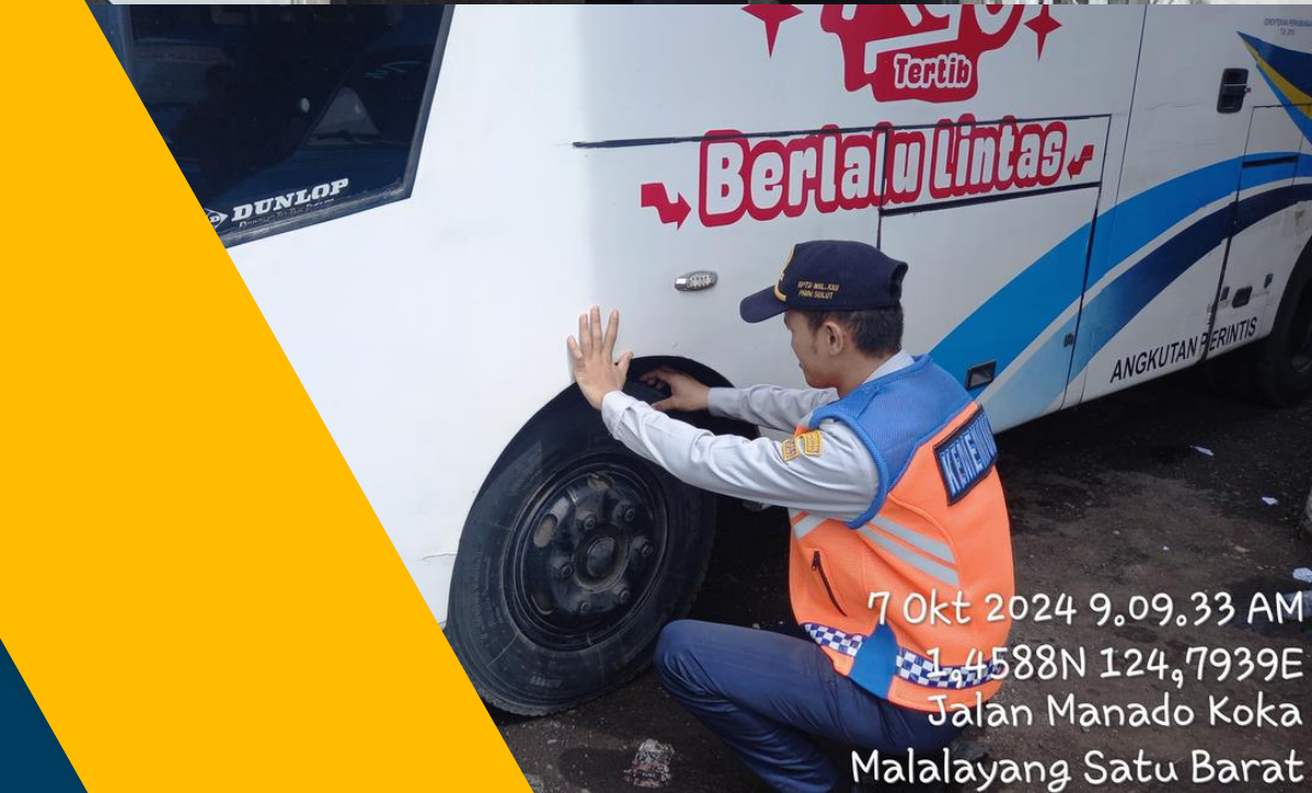
7 Okt 2024 9.09.33 AM 14588N 124,7939E Jalan Manado Koka Malalayang Satu Barat