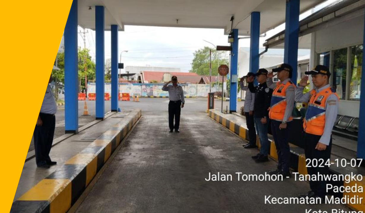
2024-10-07 Jalan Tomohon - Tanahwangko Paceda Kecamatan Madidir Kota Bitung