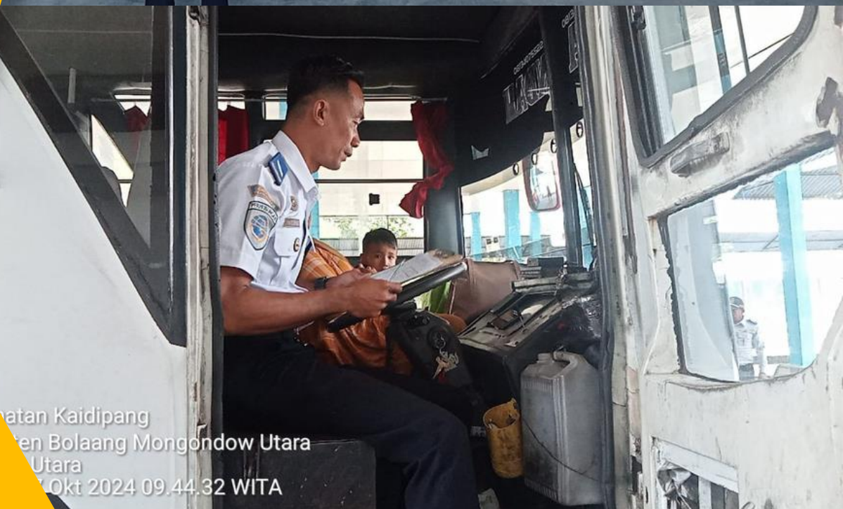
Stasiun Kaidipang Jalan Bolaang Mongondow Utara Mongondow Utara 7 Okt 2024 09.44.32 WITA