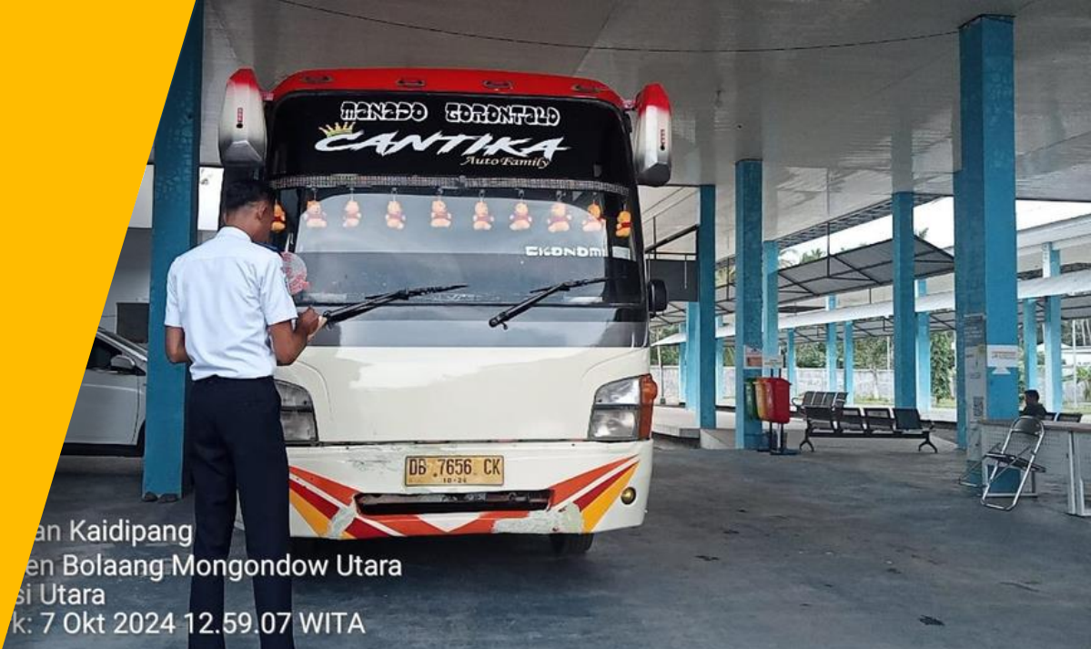
Stasiun Kaidipang Jalan Bolaang Mongondow Utara Mongondow Utara 7 Okt 2024 12.59.07 WITA