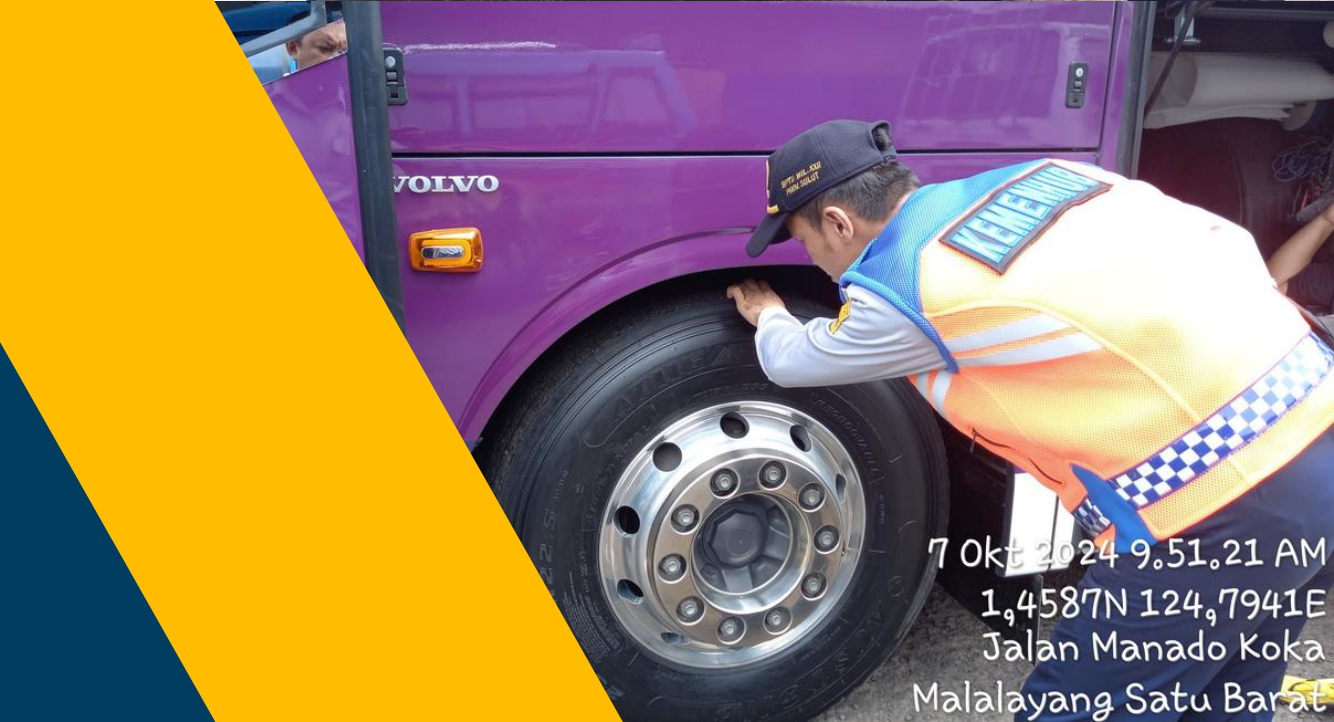
7 Okt 2024 9.51.21 AM 1,4587N 124,7941E Jalan Manado Koka Malalayang Satu Barat