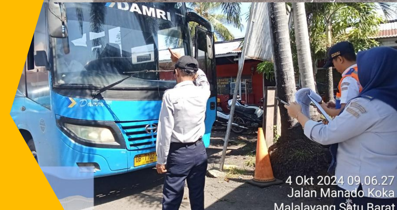
4 Okt 2024 09.06.27 Jalan Manado Koka Malalayang Satu Barat