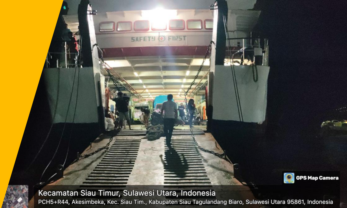
Kecamatan Siau Timur, Sulawesi Utara, Indonesia PCH5+R44, Akesimbeka, Kec. Siau Tim., Kabupaten Siau Tagulandang Biaro, Sulawesi Utara 95861, Indonesia