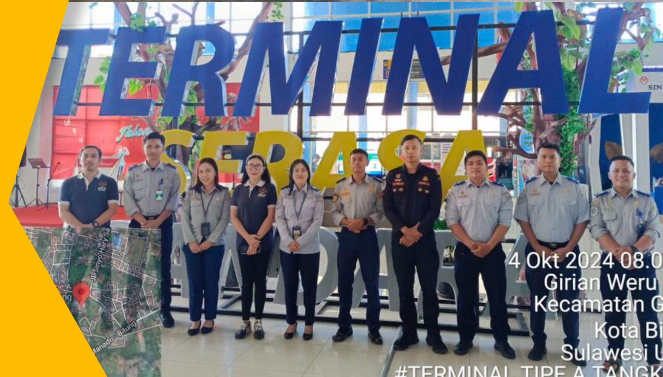
4 Okt 2024 08.0 Girian Weru Kecamatan G Kota Bi Sulawesi U