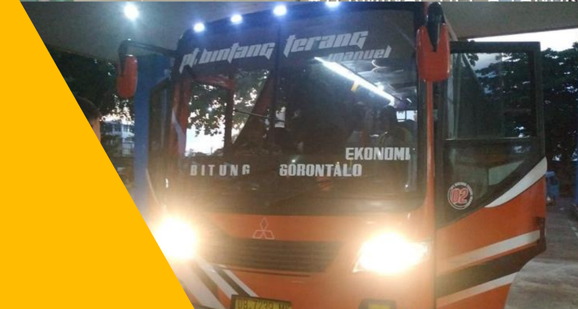
4 Okt 2024 5.10.55 No.5 Kampung