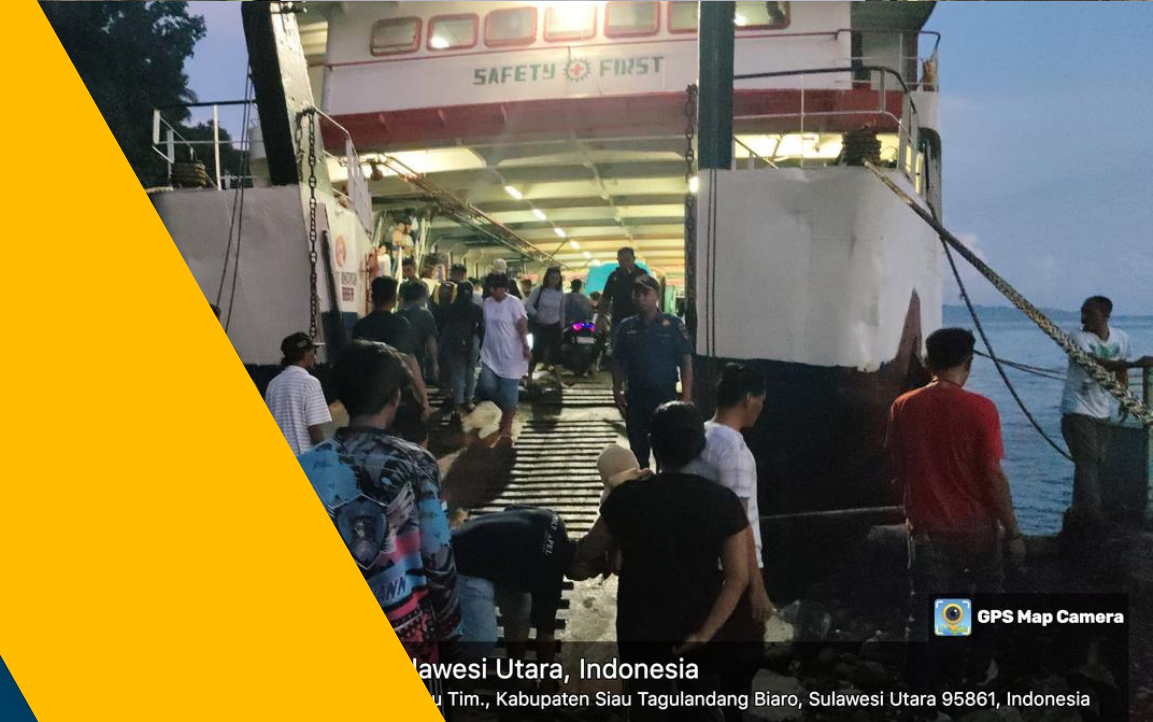
Sulawesi Utara, Indonesia Siau Tim., Kabupaten Siau Tagulandang Biaro, Sulawesi Utara 95861, Indonesia