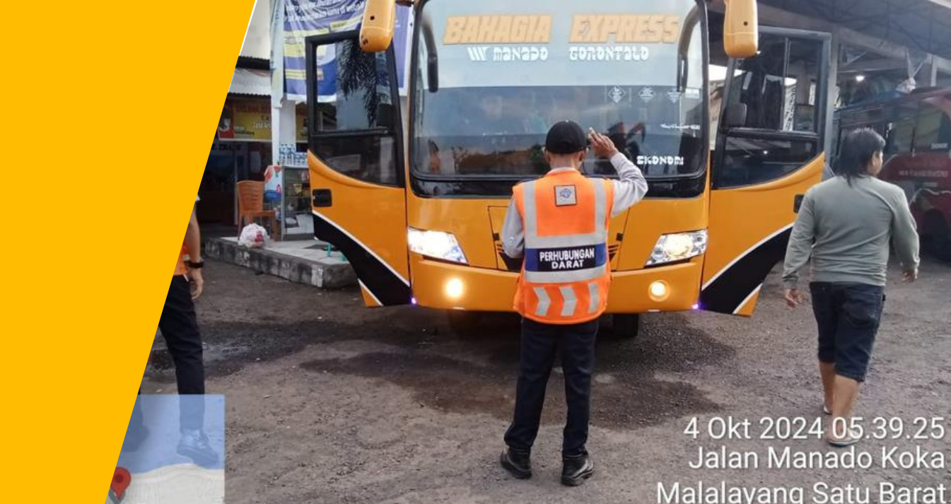
4 Okt 2024 05.39.25 Jalan Manado Koka Malalayang Satu Barat