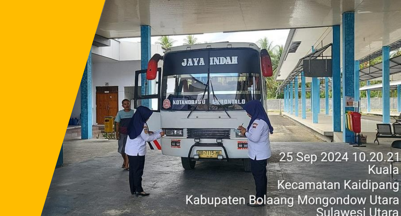
25 Sep 2024 10.20.21 Kuala Kecamatan Kaidipang Kabupaten Bolaang Mongondow Utara Sulawesi Utara