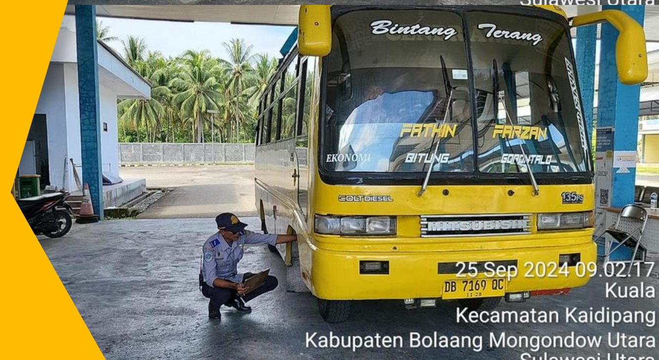
25 Sep 2024 09.02.17 Kuala Kecamatan Kaidipang Kabupaten Bolaang Mongondow Utara Sulawesi Utara