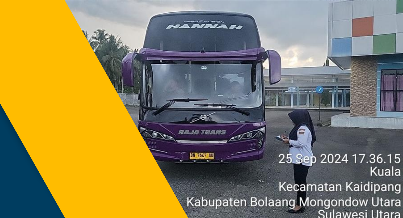
25 Sep 2024 17.36.15 Kuala Kecamatan Kaidipang Kabupaten Bolaang Mongondow Utara Sulawesi Utara