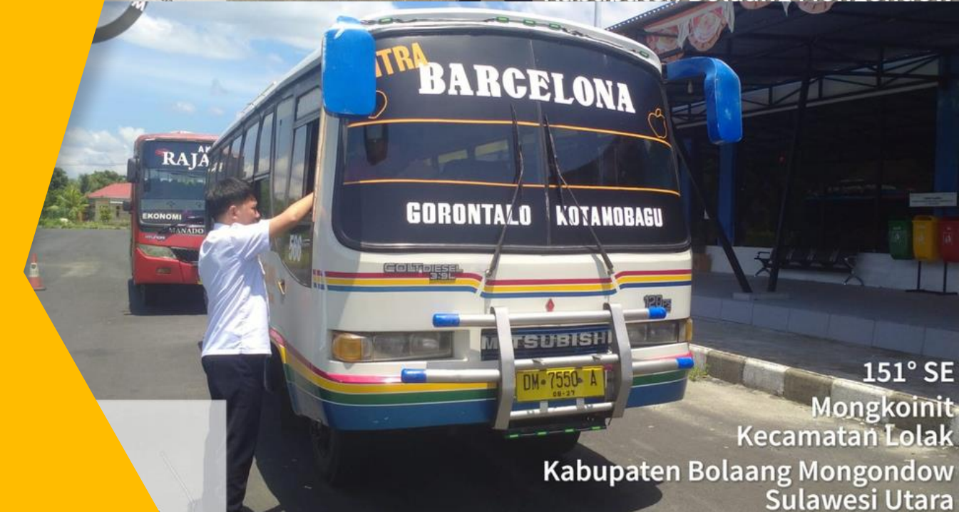
151° SE Mongkoinit Kecamatan Lolak Kabupaten Bolaang Mongondow Sulawesi Utara