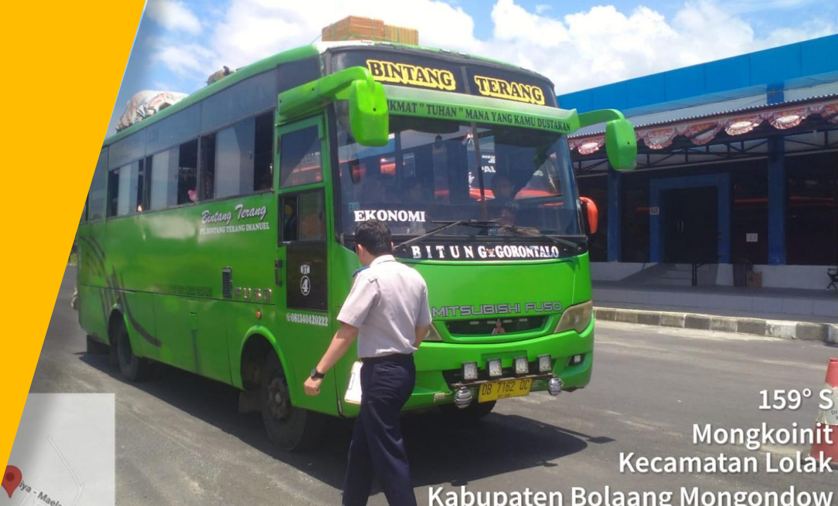
159° S Mongkoinit Kecamatan Lolak Kabupaten Bolaang Mongondow