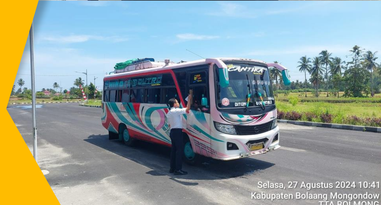
Selasa, 27 Agustus 2024 10:41 Kabupaten Bolaang Mongondow TTA ROI MONG