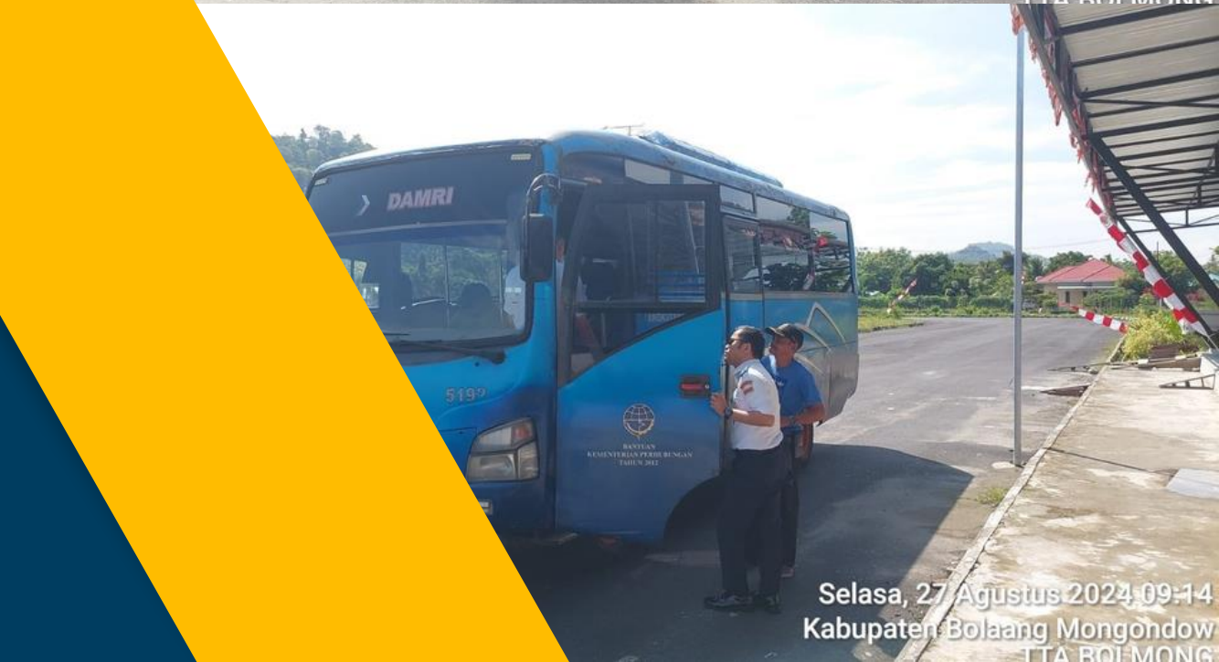
Selasa, 27 Agustus 2024 09:14 Kabupaten Bolaang Mongondow TTA ROI MONG