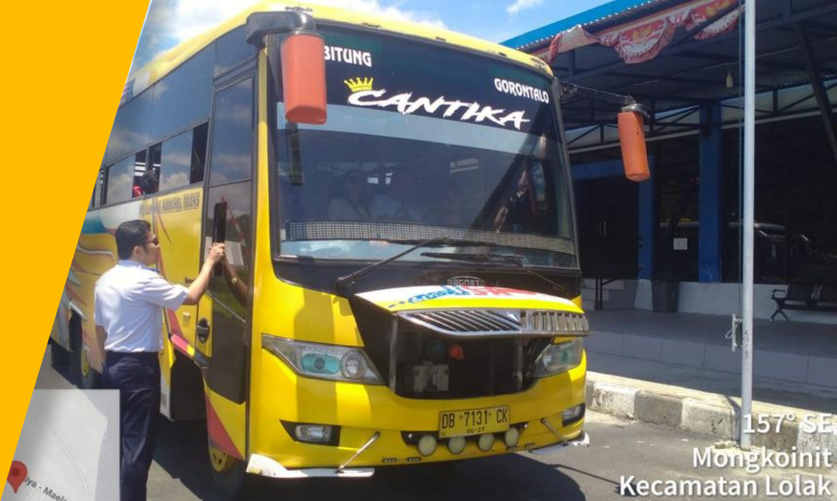
157° SE Mongkoinit Kecamatan Lolak