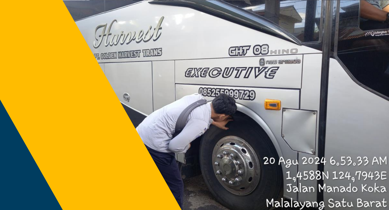
20 Agu 2024 6.53.33 AM 1,4588N 124,7943E Jalan Manado Koka Malalayang Satu Barat