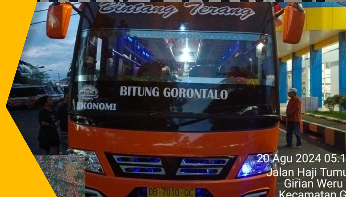
20 Agu 2024 05.1 Jalan Haji Tumu Girian Weru Kecamatan G Kota Bi Sulawesi U