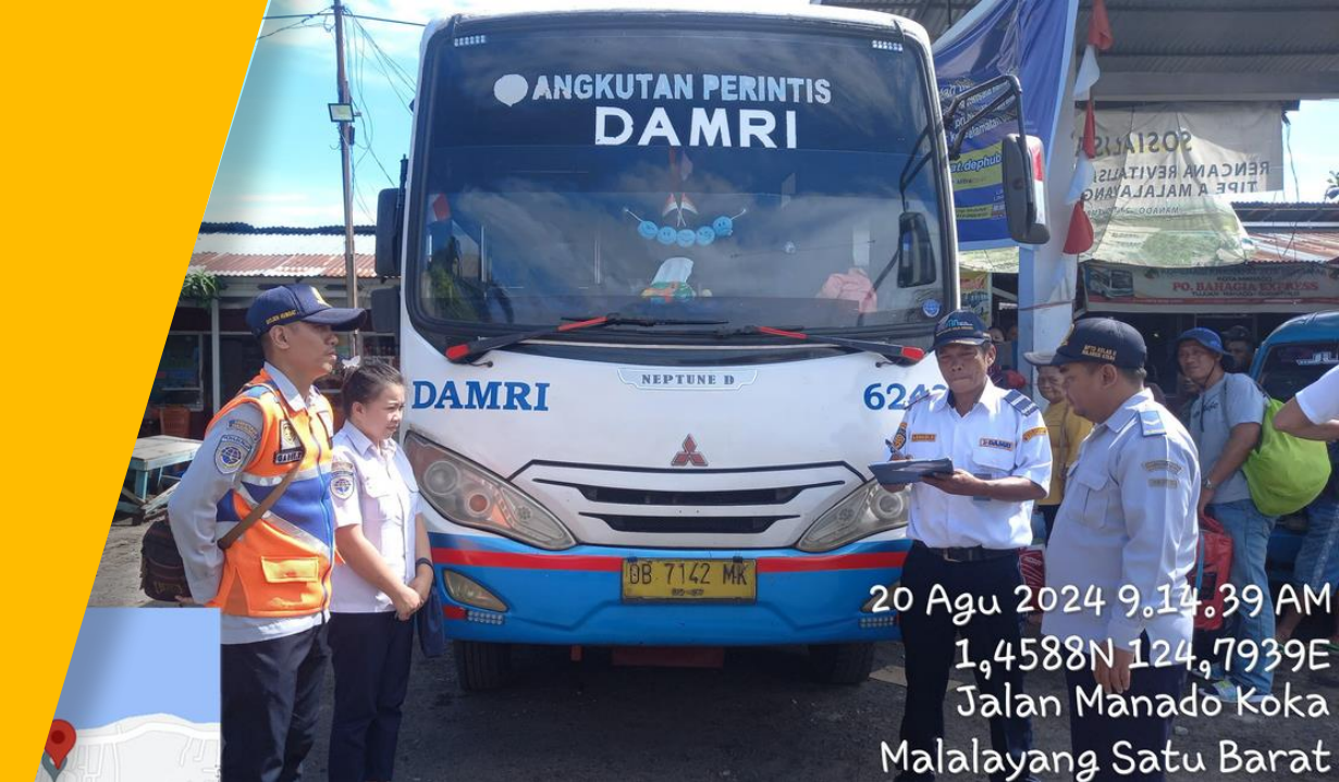
20 Agu 2024 9.14.39 AM 1,4588N 124,7939E Jalan Manado Koka Malalayang Satu Barat