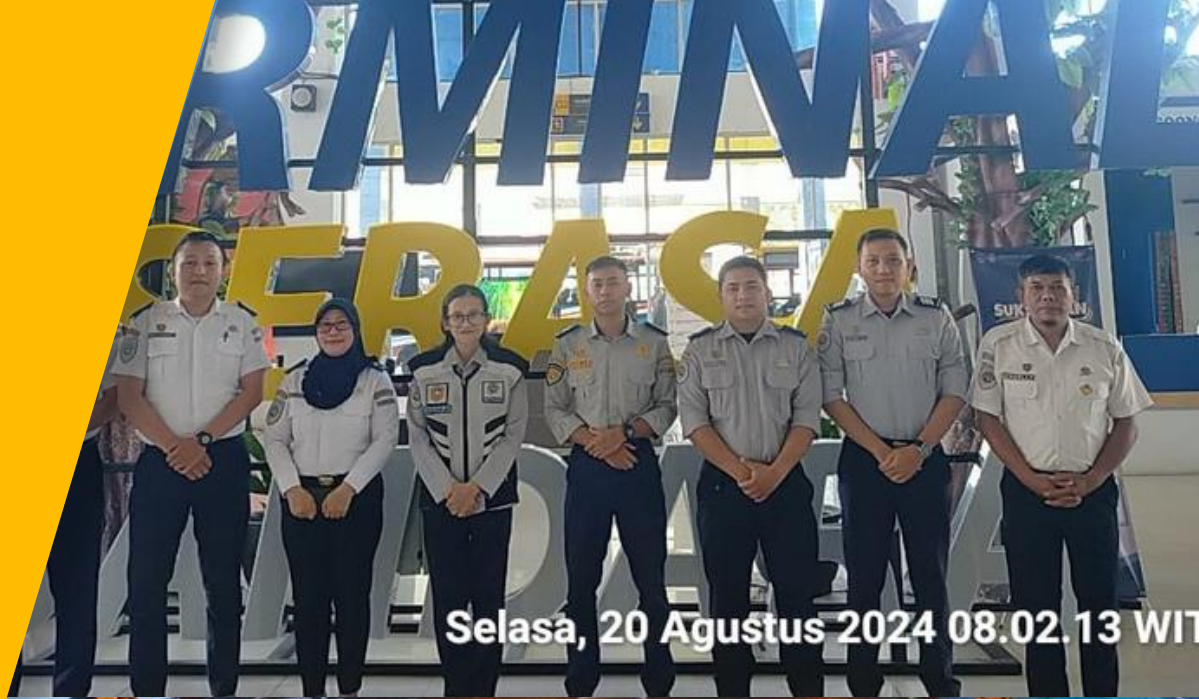
Selasa, 20 Agustus 2024 08.02.13 WIB