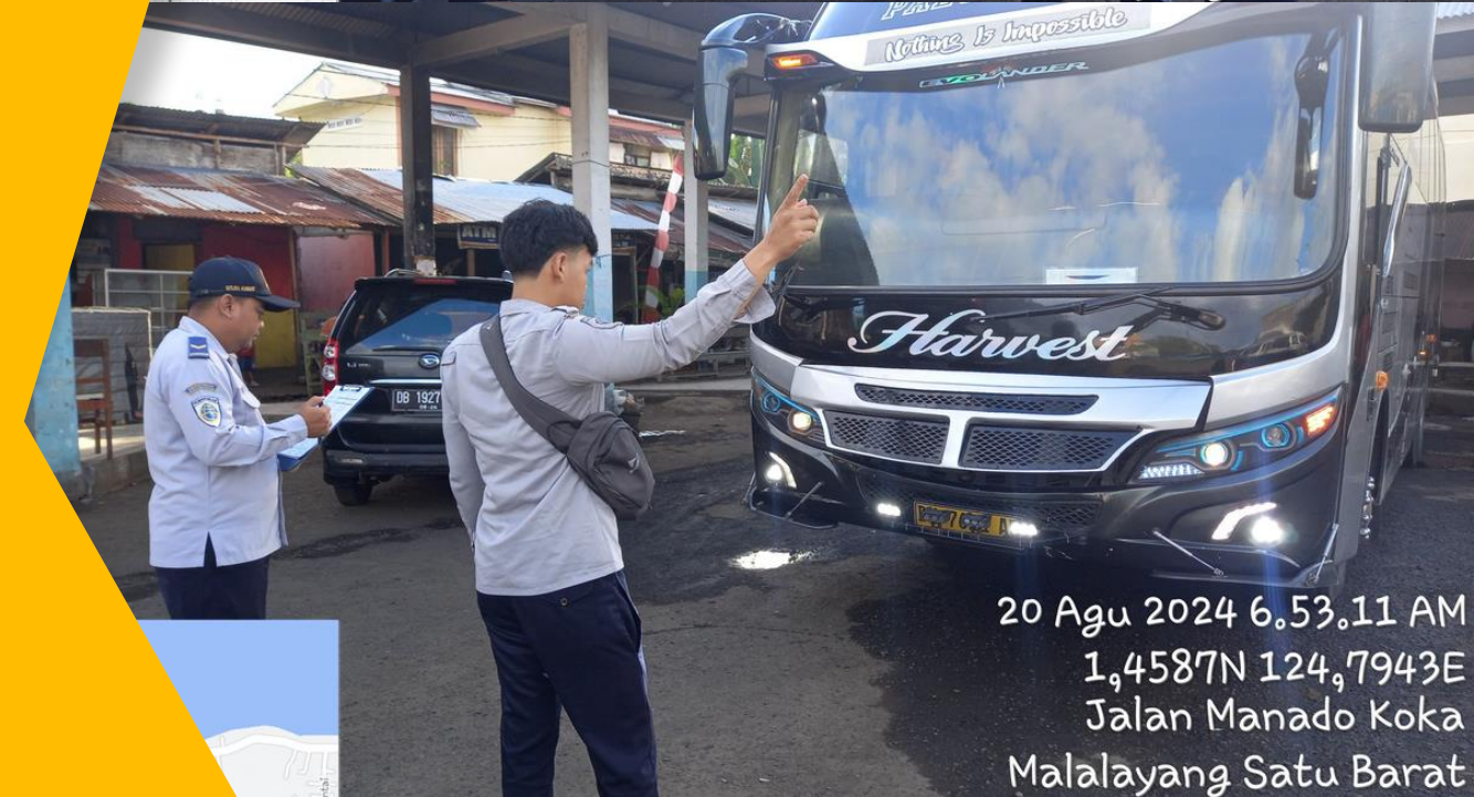
20 Agu 2024 6.53.11 AM 1,4587N 124,7943E Jalan Manado Koka Malalayang Satu Barat