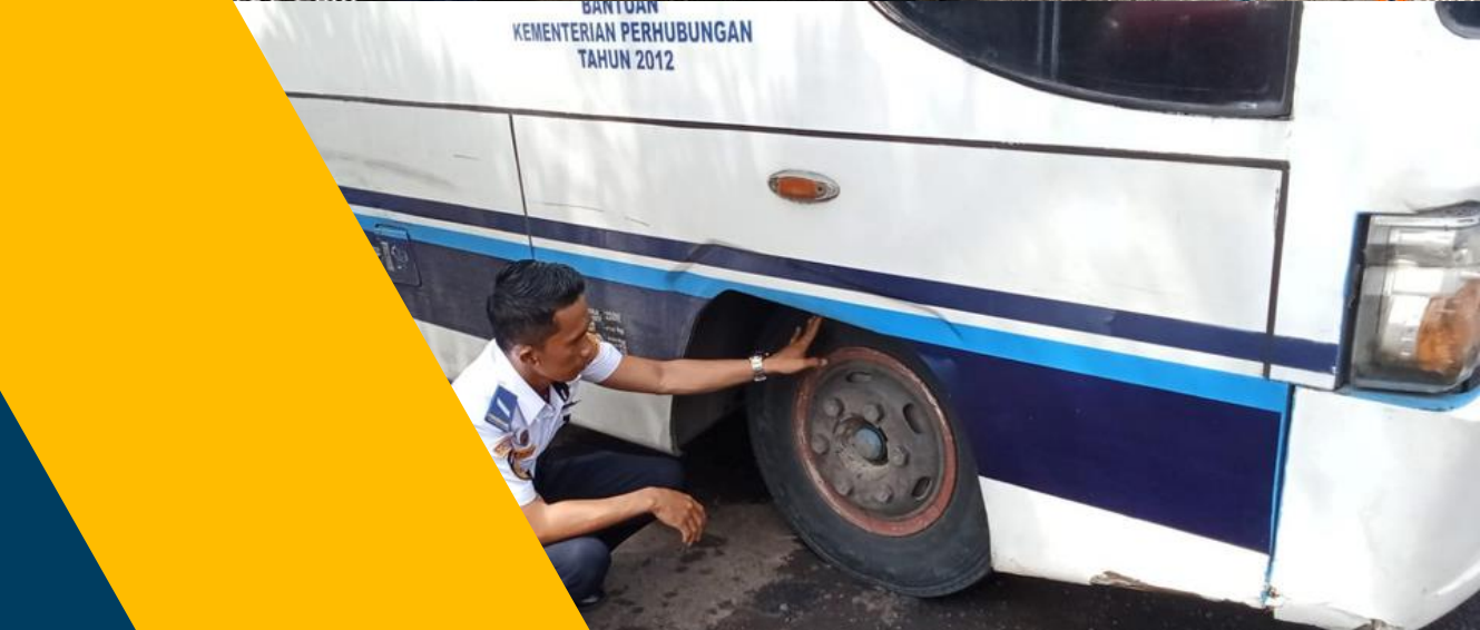
17 Agu 2024 13:49:20 Jalan Manado Koka Malalayang Satu Barat